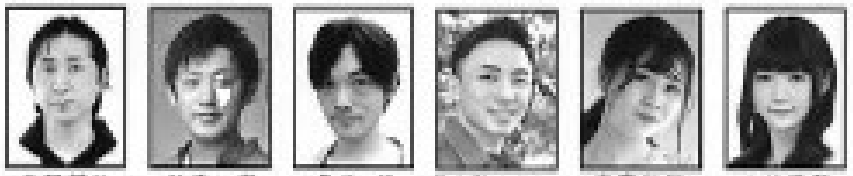
久賀健治 (プロデュース) 秋吉 徹 (プロデュース) 高橋 洋 (ARCADIA) 五十嵐イサコ (マラー) 中野野智 (プロデュース) 小林清史 (マラー)